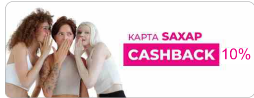
КАРТА CASHBACK 10%

ШАГ 1. ПРОЙДИТЕ ПО QR-КОДУ И УСТАНОВИТЕ КАРТУ WALLET